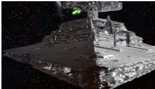
Georges Lucas – L'Empire contre-attaque - 1980