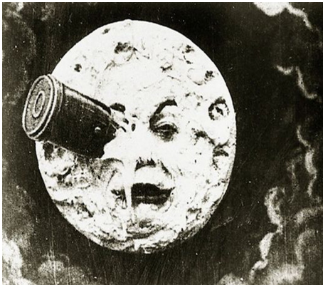
Georges Méliès – Le Voyage dans la Lune - 1902