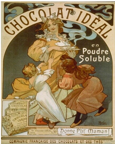
Mucha, Chocolat idéal – lithographie en couleurs – 1897